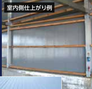
室内側仕上がり例